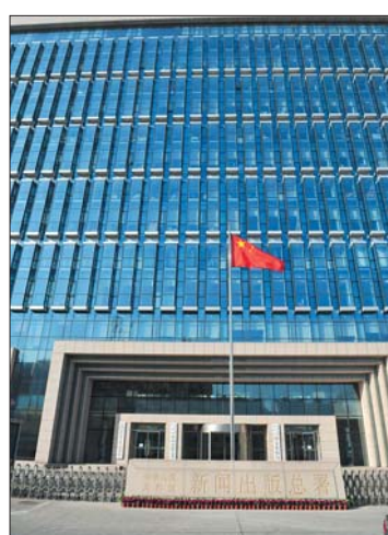
新闻出版总署大楼

组建国家新闻出版广播电影电视总局有哪些考虑?中央编办负责人在回答新华社、人民日报记者提问时称:随着以数字技术、网络信息技术为核心的现代信息传播技术的不断创新和广泛应用,多种媒体综合发展。为进一步推进文化体制改革,统筹新闻出版广播影视资源,促进新闻出版广播影视业繁荣发展,这次改革,将新闻出版总署、广电总局的职责整合,组建国家新闻出版广播电影电视总局。这样调整,有利于统筹推动报刊、出版社、通讯社、电台电视台和互联网等新媒体发展,加快构建现代传播体系,提高文化传播能力;有利于新闻出版广播影视业做大做强,增强文化整体实力和竞争力;有利于整合新闻出版和广播影视领域公共服务资源,提高公共文化服务的质量和水平。