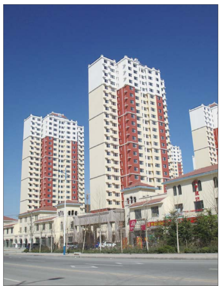
10日下午,黄河八路渤海十二路附近的楼盘。