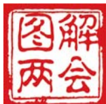
制图 本报美编 许雁爽

新一届全国政协领导人的选举产生过程,为世人瞩目。酝酿过程体现出协商民主的哪些特色?选举程序如何保证结果的公平公正?细微之处怎样保障委员充分行使权利?