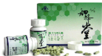
知蜂堂蜂胶,每盒两瓶,共100粒。

具有显著治疗作用的蜂胶必须是纯正的,添加其它物质并不能提高疗效。糖尿病患者要认清,你要用的是蜂胶,不是那些添加物,改善并没有用的是蜂胶,更不是那些添加物。这些厂家之所以这样做,一是炒作概念,吸引眼球;二是添加其它物质,蜂胶用的少了,就会降低成本。蜂胶的作用在于其300多种有效成分的协同作用,只有纯蜂胶这种天然配比才不会破坏,才能发挥神奇功效。糖尿病患者用“纯蜂胶”,那就来知蜂堂。