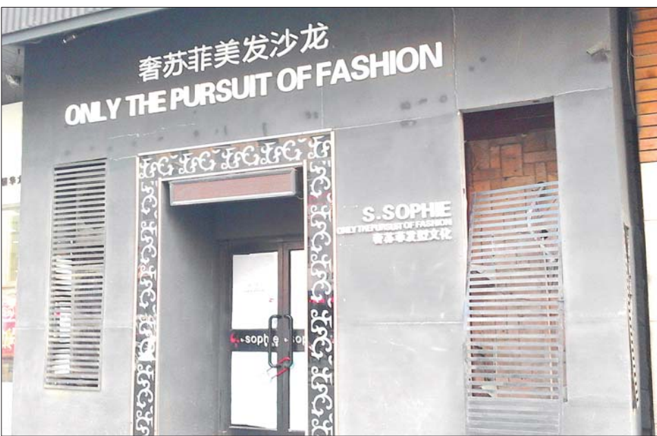
位于华龙路上的奢苏菲美发沙龙大门紧闭。

徐先生介绍,从10日下午到11日下午,他已经遇到好几位顾客询问会员卡的事了。徐先生把这些人的联系方式都记了下来,并告诉他们等联系上店主后与他们联系。徐先生介绍,店主妻子再过一个两个月就要生孩子了,家里有个患癌症的父亲,现在出现这种情况,估计店主可能遇到什么事了。