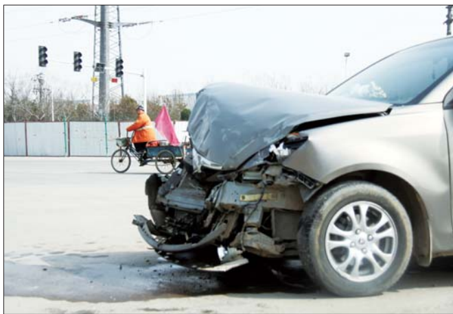
事故车辆前部已经严重变形，路口的红绿灯并没有亮。

随后，记者将此事反映到高新区交警大队，高新区交警大队的工作人员表示，会尽快修好红绿灯。