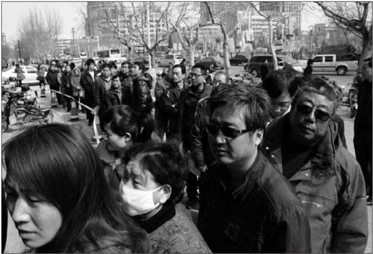
11日上午，市民在房产交易中心门前排起了长队。本报记者 吴凡 摄

“我们延长了工作时间，60多人满负荷运转”，上述负责人介绍，为应对业务量陡然上升的压力，潍坊市房产交易中心也采取了多种措施应对，尽最大努力为办事群众提供高效便捷的服务。房产交易中心增加了服务窗口，由原来的3个增加到12个；受理人员由6个增加到24个；工作时间改为早上7:50到下午5:30,中午不休息,在受理台前吃盒饭;同时加班查询信息，每晚5:30到10:30、周六及周日60多人加班查询信息，并联合辖区派出所,增加保安人数,放好警戒线,维护好现场秩序,采取分流办理等方式,给群众创造良好的办事环境。