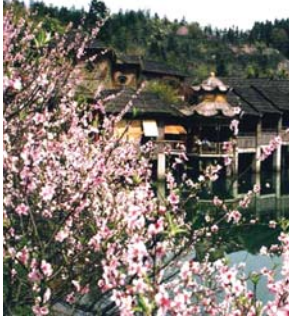
桃之夭夭，灼灼其华。每年3到4月，在安徽黟县都会举办一场规模浩大的桃花节，今年已经

是第七届了。走过古街古桥，推开关麓八大家厚重的木门，行在南屏幽静的古巷，来到深冲采摘绿意，奔向五里观赏春光…… 五里村的千亩桃园，深冲村的千亩茶园，乡村里遍野的油菜花是黟县得天独厚的乡村旅游资源。黟县利用得天独厚的乡村旅游资源，推出独具黟县特色的赏花—采茶体验—徽菜美食游等差异化的乡村旅游产品，品一次桃花盛会，寻一回桃花之缘，悟一门桃