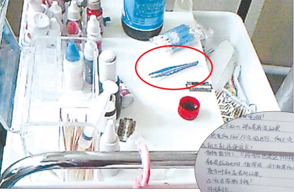
►朝山街上的 一家美容中心, 做折线手术的 镊子就随意放 在桌子上。

一条一条的,有的则不洗手直接用手 撕。美容师叮嘱记者,清洗过化妆品的 残渣后要将器皿擦干,而用来擦拭的 毛巾,床单都是桶里面顾客已经用过的。