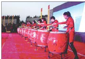
2013年元旦,乐动新年。(资料片)

在美陈大赛评选中,日照市8个单位获奖。日照汽车总站获“年味最浓的汽车站”奖;莒县城阳街道西大街村、岚山区岚山头街道凤阳路社区和山海天旅游度假区乔家墩子民