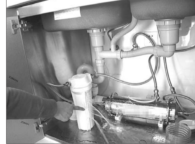
净水器的过滤器裂了。

“我们的产品不存在质量问题,不排除生产过程中有某个小零件出现小问题,不过这种情况很少出现,我们愿意进行适当的赔偿。”随后,记者联系了净水器的销售经理蒋先生,经过双方多次交涉,商家给了杜女士20000元作为赔偿,并同意为杜女士重新换一台净水器。