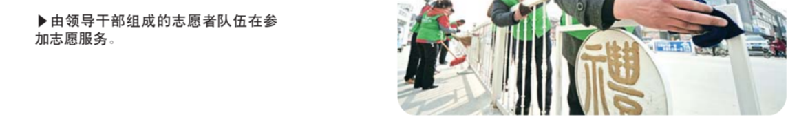
▶由领导干部组成的志愿者队伍在参加志愿服务。