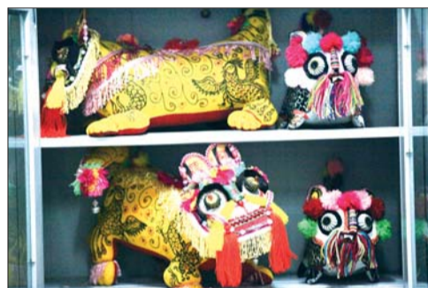
各式各样的渔家虎饰摆放在展柜内。