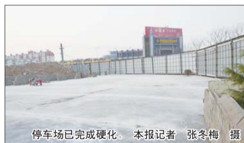
停车场已完成硬化。

本报枣庄3月14日讯(记者 张冬梅 通讯员 宋传太) 14日,记者了解到,为方便城南的市民停车,滕州南外环附近将新增一处停车场。