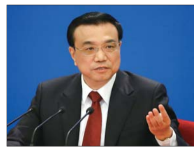
回答记者提问时,李克强肢体语言丰富,先后做出了一、二、三、四的手势。