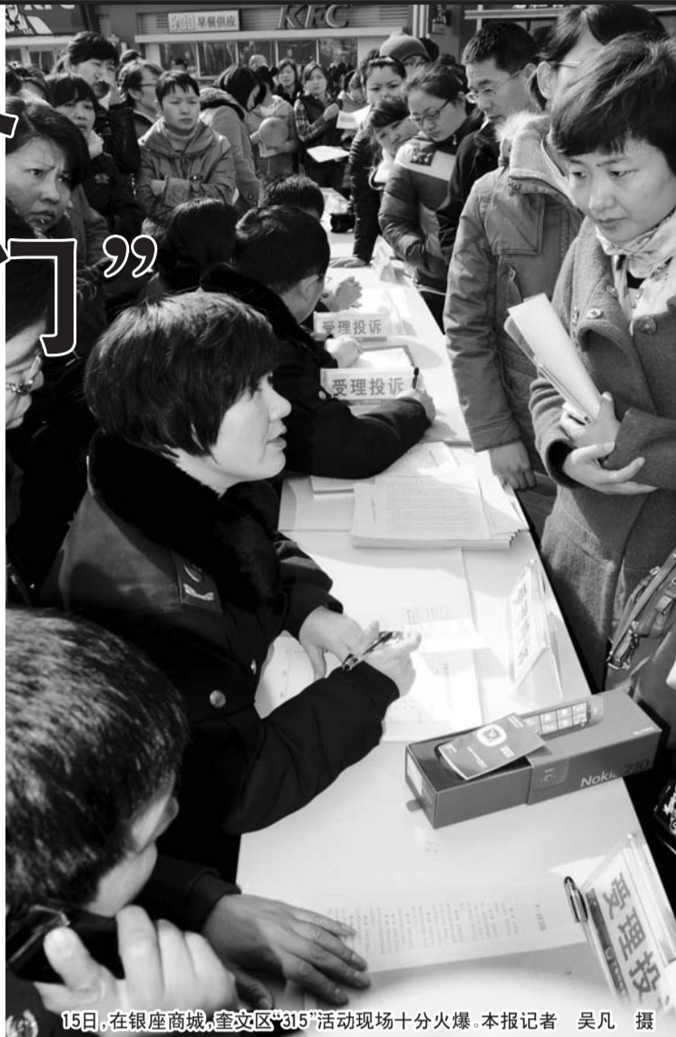
15日,在银座商城,奎文区“315”活动现场十分火爆。

本报3月17日讯(记者 赵松刚 实习生 王立兰 代海云)3月15日,奎文区、潍城区、人民商城分别设立市民投诉点。当日,3处投诉点共受理38起投诉。一些市民在投诉时因不知管辖地而“摸错门”。有市民建议,3处投诉点可以在接受投诉后再进行分区处理。