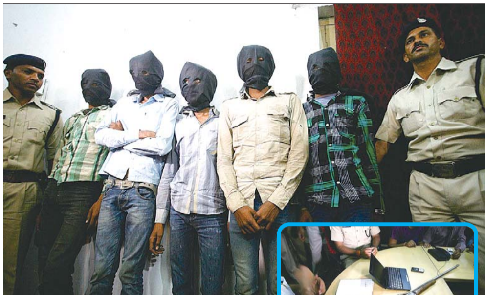
▲17日,被印度警方抓获的5名犯罪嫌疑人。

印度警方17日说,5名遭拘押的村民承认15日晚轮奸一名瑞士女游客并袭击她的丈夫。警方正搜捕其他可能涉案的嫌疑人,期望能尽快结案。18日,警方表示已将另一名嫌疑人抓获,涉案的全部6名男子于当天受控出庭。