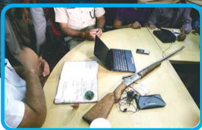
▶嫌犯作案时使用的工具和抢劫的财物。