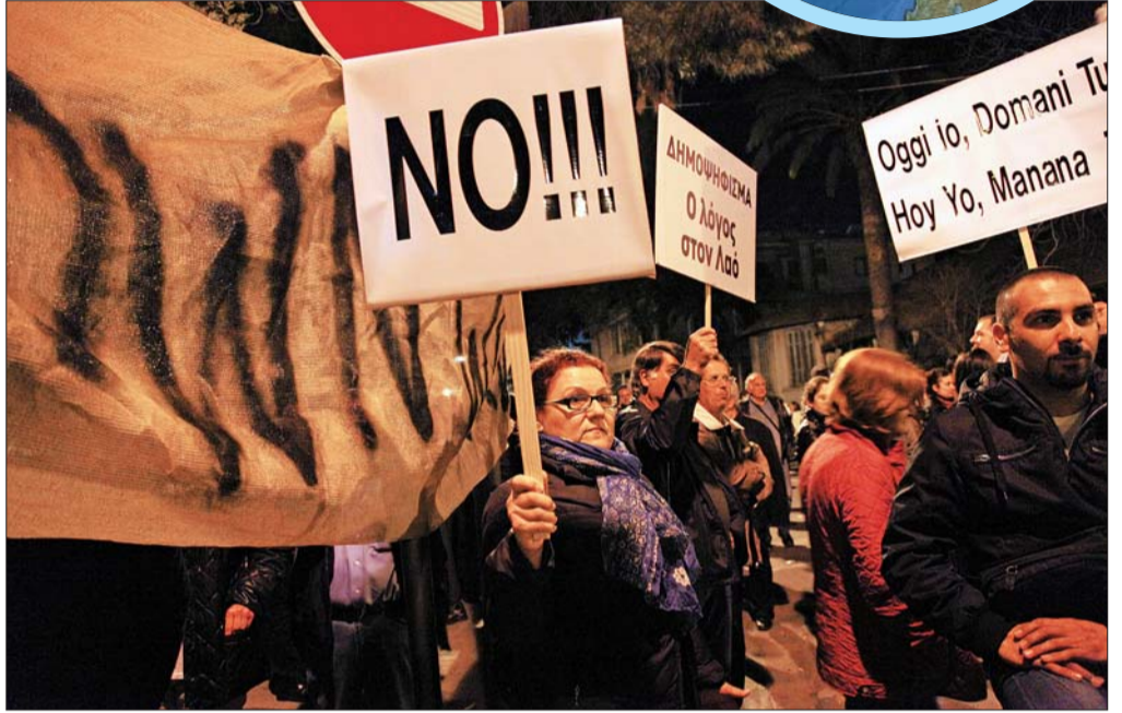
19日,在塞浦路斯议会大楼外,人们举着牌子参加集会示威,对存款征税议案表示抗议。