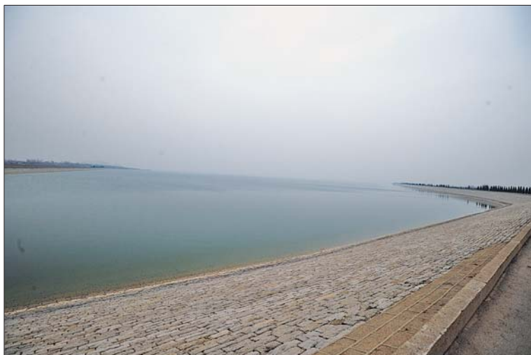
“骑行探访水源地”目的地——鹤山水库。