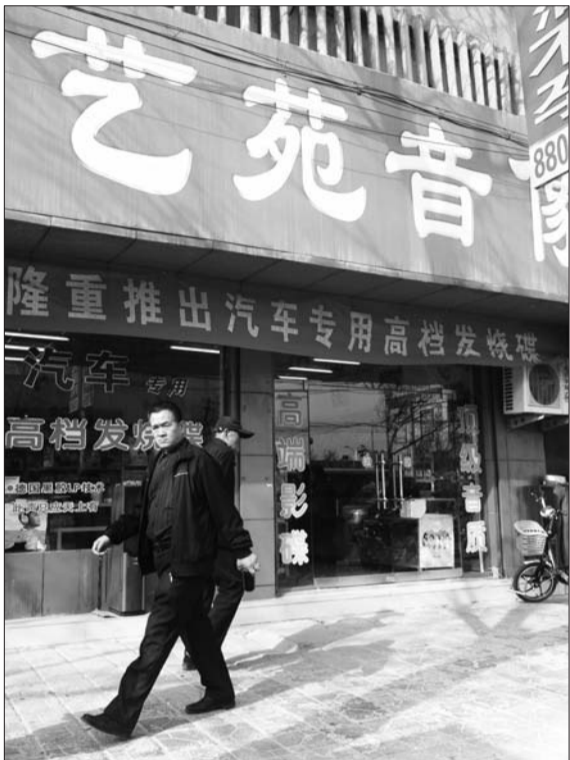
随着网络的冲击,城区音像店越来越少,他们现在更注重车载CD和高档碟片的销售。

随着电脑的普及,网络下载已经成了人们特别是青少年获取音像资料的主要途径。上网下载歌曲MV的人越来越多,而去音像店购买碟片的人随之变少。曾经辉煌一时的音像店,逐渐淡出了人们的视线。