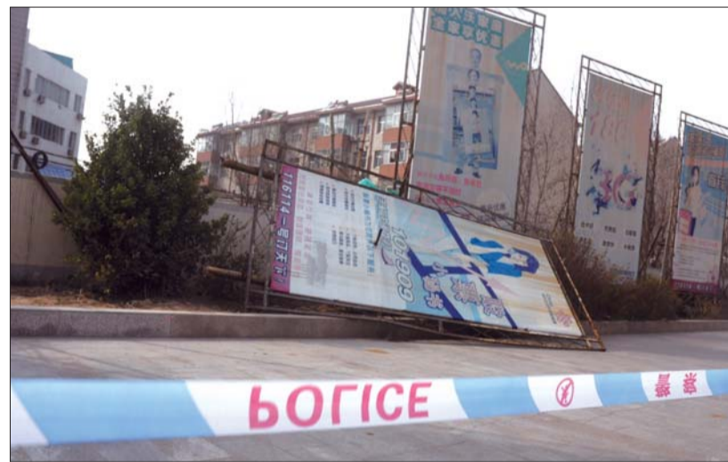
◀东风路上的一处广告牌被大风刮断,工作人员在周边拉起警戒线。

德州市住房和城乡建设局工作人员陈太雷告诉记者,《建筑工程安全技术操作规程》规定,遇有恶劣天气(如风力在六级)影响施工安全时,禁止进行露天高处及登高架设作业,起重和打桩作业。“我们在恶劣天气时会通知各个工地要停止高空作业,并到工地实地检查。”陈太雷称,发现企业违规会要求其限期整改,拒不整改的将对其停工。