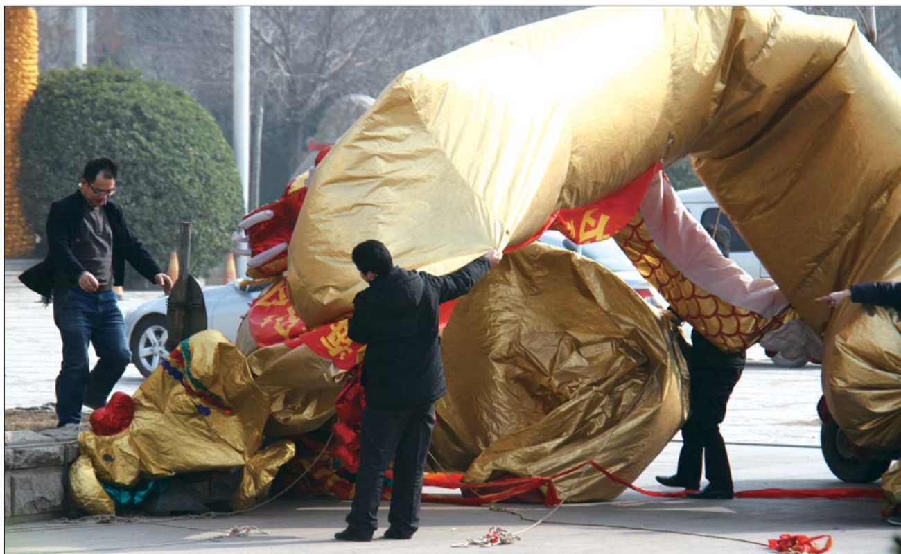
德州大酒店门前的结婚拱门被刮倒,工作人员奋力将拱门收起。