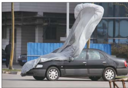
▼东方红路上一私家车的车罩被大风刮起。

齐鲁晚报 全球排名 22位 中国品牌 500强 中国晚报 3甲 日发行量 160万