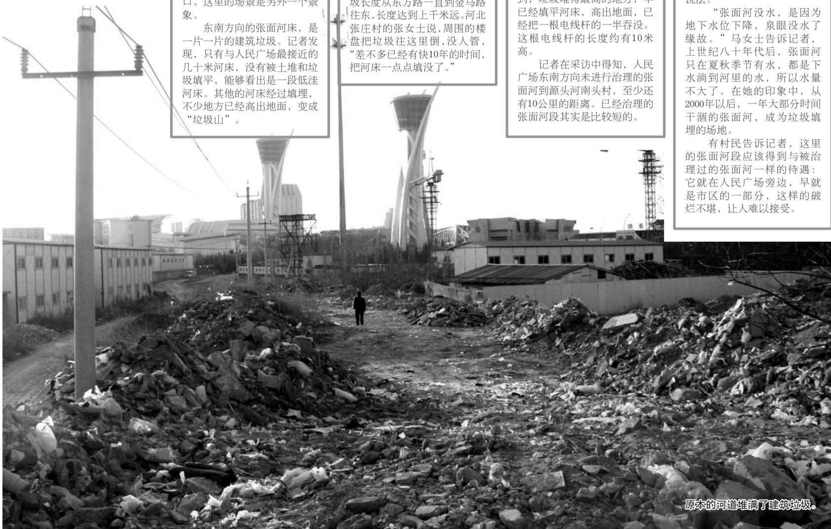
原本的河道堆满了建筑垃圾。

有村民告诉记者,这里的张面河段应该得到与被治理过的张面河一样的待遇:它就在人民广场旁边,早就应该是市区的一部分,这样的破烂不堪,让人难以接受。