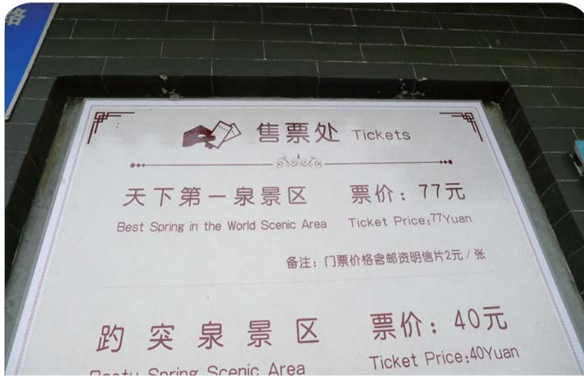
25日,“天下第一泉风景区”正式挂牌,景区通票价格为77元。

记者了解到,“天下第一泉”申报5A级景区主要有三个步骤,首先要通过国家旅游局的评审,然后进行明察暗访和问卷调查,对景区细节进行考核。