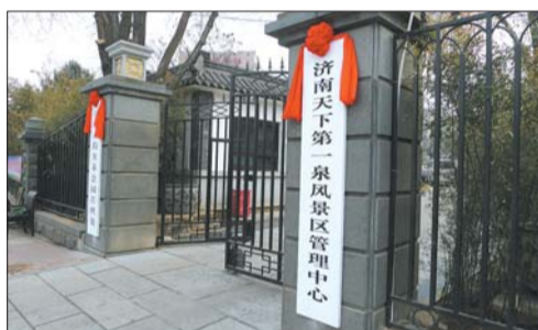
25日,济南趵突泉公园挂上了“天下第一泉风景区”的牌子。