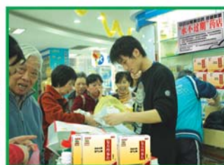
“永不过期”药店更换现场