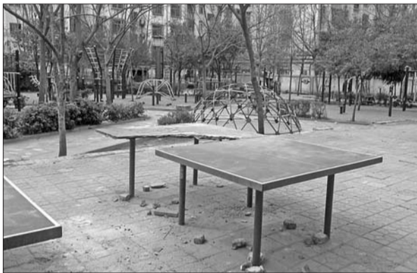
建设器材损坏严重。