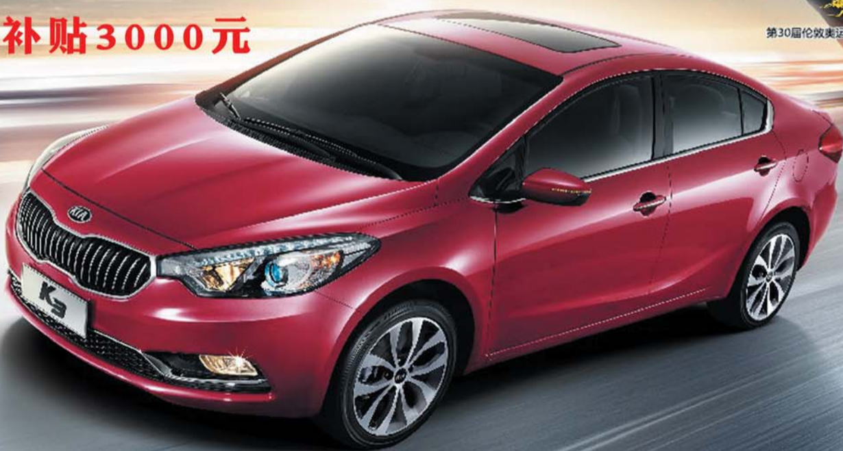
第30届伦敦奥运会乒乓球冠军 张继科