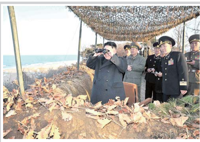
▲25日,金正恩(左一)指导朝鲜人民军进行登陆及反登陆训练。

“天安”号2010年3月26日晚在韩国西部海域值勤时爆炸沉没,104名官兵中58人生还,46名水兵丧生,1名海军潜水员在搜救中殉职。韩国主导的国际调查认定朝鲜小型潜水艇用鱼雷击沉“天安”号,朝鲜一直坚决否认。