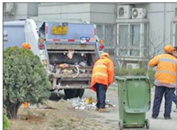
在城管部门的介入下,原来堆在小区空地的垃圾近日曾被清理过。