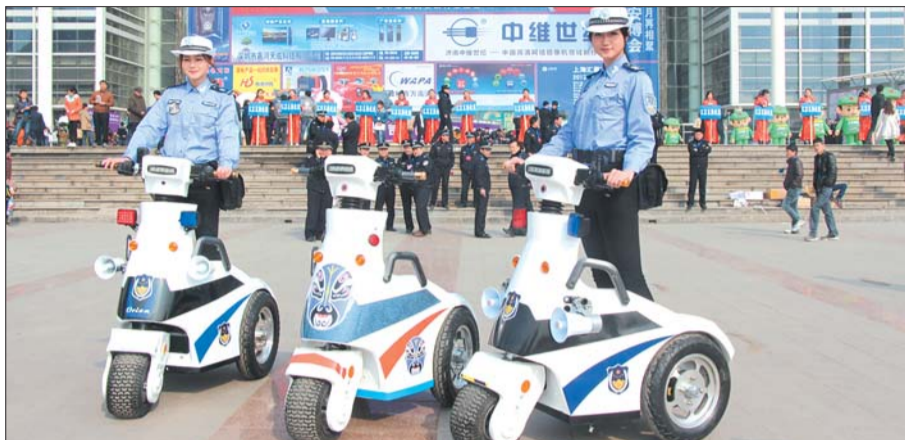
站立巡逻三轮车。

在此次博览会上,记者从济南警方获悉,现在全市的监控探头已达到18万个,警方将建立专门的监看队伍,通过监看监控来打击犯罪。