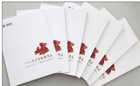
2012年,枣庄供电公司发布服务枣庄经济社会发展白皮书

3月15日,国家电网山东枣庄供电公司发布2012年社会责任实践报告,报告从点亮“富庶枣庄”、“宜居枣庄”、“文化枣庄”、“活力枣庄”和“安康枣庄”五个方面,展现服务幸福新枣庄建设的履责行动和绩效。这是该公司第五年发布社会责任实践报告,也是山东电力唯一一家连续5年发布社会责任实践报告的地市级公司。