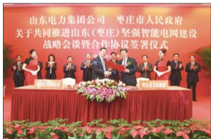
山东电力集团公司与枣庄市政府签订关于共同推进枣庄坚强智能电网建设战略会谈暨合作协议签署仪式