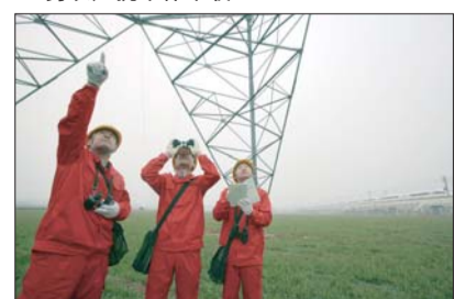
加强高铁巡视力保高铁大动脉畅通无阻