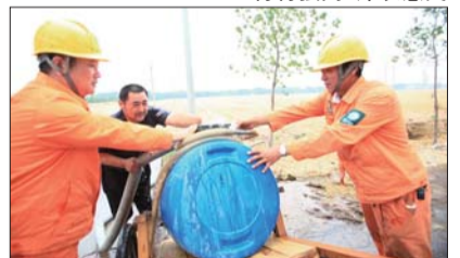
国家电网彩虹共产党员服务队服务农户抗旱保丰收