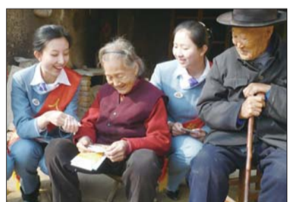
为老年客户提供上门服务