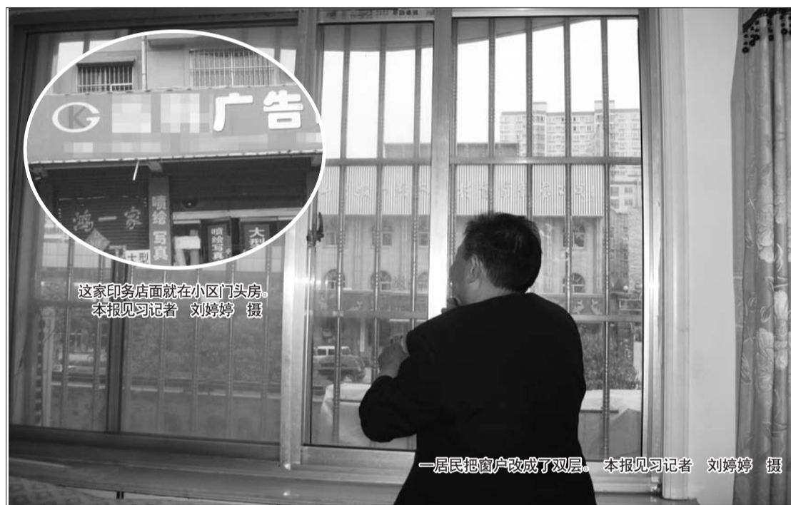
这家印务店面就在小区门头房。