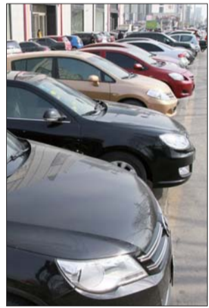
五星百货门前的停车位上,停满了车。

“每逢双休日停车压力比较大,初步统计也有2000多辆车聚集到中心商圈。”市交巡警支队副支队长王华民介绍。如此算来,每到周末,有数百辆车势必遇到停车难的情况。