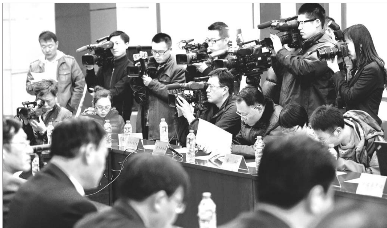
28日举行的济南BRT调价发布会吸引了大量媒体参加。

常州的公交票价为江苏省内其他城市所艳羨,不管是普通公交还是BRT票价都非常低,即投币1元,刷卡六折,学生卡三折,老年卡二折,其他免费群体一样享受优惠。郑州BRT票价刷卡1元,投币2元。(综合)