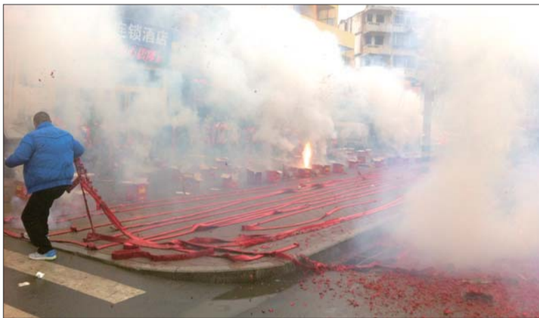
开业鞭炮燃放后腾起的烟雾四处弥漫。

本报3月30日讯(记者王光营) 30日,青龙桥附近某连锁酒店开业,这阵势,一条街硝烟弥漫!”30日中午,有网友在微博中表示,青龙桥附近某连锁酒店开业,不仅鞭炮铺了一地,还有数十箱礼炮,放起来一条街都被浓烟覆盖,几乎看不见对面的人。记者在现场看到,这