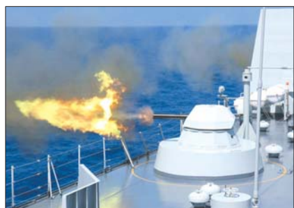
3月31日,我海军编队在西太平洋公海开展对海实弹射击训练。

进入西太平洋训练区以来,编队各兵力群还进行了以反恐、反海盗为内容的维权针对性训练以及反空反导、舰载直升机昼间着舰、反潜和搜索救援等实战化科目训练。