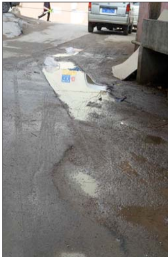
小区被开挖的路面泥泞不堪。

“不管是属于哪个部门负责,挖开之后总得恢复平整,这样(不管)怎么能行呢?”尹女士说,他们希望相关部门能实地查看一下情况,帮居民解决这个问题。