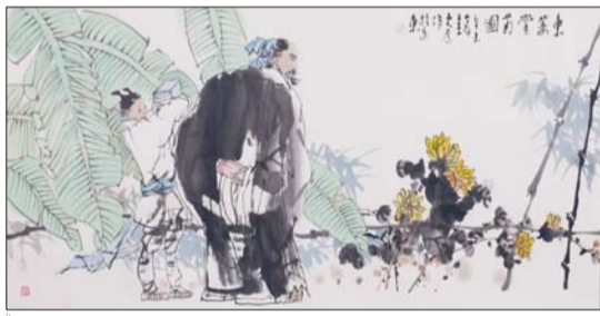
东篱赏菊图 刘大为

继2009年北京保利拍卖公司展开了“荷兰式拍卖”这一由高到低依次递减的竞价拍卖的新局面后,今年恒昌迎春拍中又开创了“打包式拍卖”这一新颖的拍