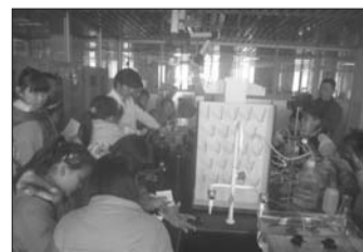
学生们参观餐厨垃圾回收过程。

本次实践活动，收到调查垃圾明细530份，调查自留地情况180份，问卷调查362份，爱土金点子268个，活动感悟682份，爱土土宣言219份，全校师生不仅了解了学校周边崂山区的土壤污染及耕地变化现状，外来务工学生还了解了自家家乡的耕地变化状况，增强了学