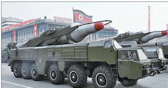
朝鲜“舞水端”中程导弹。(资料片)

日前,韩国海军在朝鲜半岛东部和西部海域各部署一艘“宙斯盾”驱逐舰,以应对朝鲜可能发射的中程导弹。同时,韩国官员5日说,如果韩方人员安全受到威胁,韩方将从开城工业园区撤人。