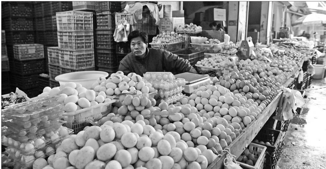
4月6日,上海龙上农副产品批发市场,鸡蛋摊位前冷冷清清,H7N9禽流感对蛋类销售造成一定影响。