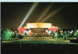
冀鲁豫边区革命纪念馆 (AAA)