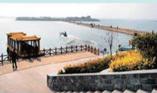
单县浮龙湖生态旅游区 (AAA)