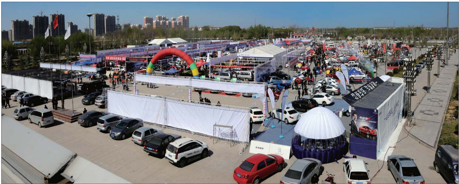
本届车展规模最大,车辆最多。