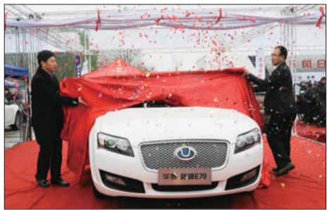
车商销售业绩不错。本报记者 邓兴宇 摄