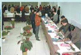
巨野中国农民画创作基地 (AA)