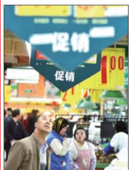
▲4月9日,市民在一家超市内查看蔬菜价格。

4月9日,国家统计局公布的宏观经济数据显示,3月份CPI同比上涨2.1%,环比下降0.9%。相关专家一致表示,数据回落具有鲜明的季节性因素。中国人民大学财政金融学院副院长赵锡军表示,“公款消费限制”等系列措施对商品零售销售、餐饮行业波及较大。