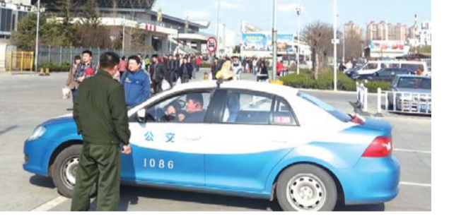
面对数百名下车旅客，待租区内剩下的唯一一辆出租车实难招架。