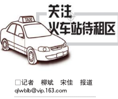
关注 火车站待租区

的哥说收取一块钱进站费是他们不愿进站拉客的直接原因，对此有人提出实行流水发车的新思路