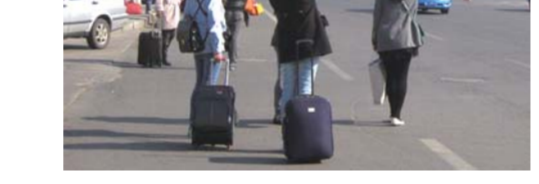
海港路不允许出租车停车拉客，不少不知情的旅客仍在招手打车。