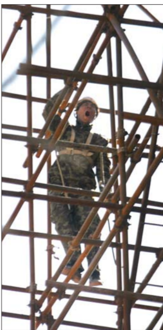
在加紧施工的状态下,一名工人累得在架子上打起哈欠。