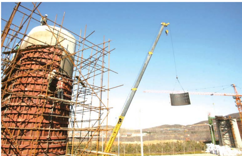
北珠岩跨越城高速特大桥施工现场,工人们干劲十足。

记者从青荣城铁指挥部获悉,中铁二十局承建的第四标段全长有61.5公里,其中约78%的线路是桥梁和隧道,最主要的目的是为了节约用地,减少铁路占地面积。此外,考虑到普通路基有沉降的可能,所以多用桥梁和隧道,也是为城铁更安全地运行提供有力保障。