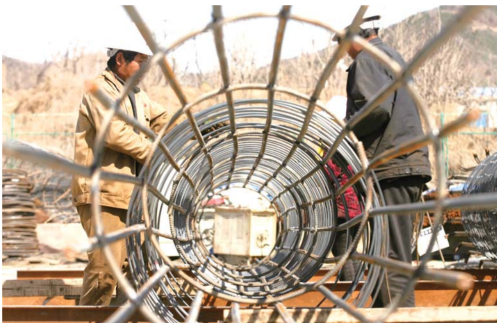
工地上,工人们在扎做桥墩用的钢筋架子。