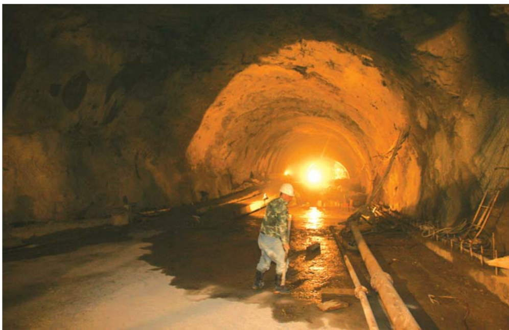
秦山隧道内,工人们在加紧施工。