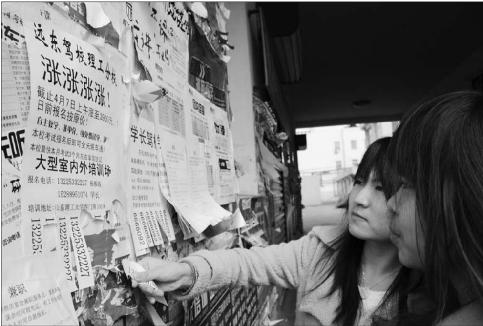
▲在理工大学校园宣传栏内,贴着着驾校涨价的宣传单。

“根据省局新规,C1驾照培训费由上下浮动20%扩大为了30%,淄博将在这个幅度内确定具体收费政策。”朱科长说。目前C1驾照培训费是2600元,按照省局规定的最大上调幅度30%计算为3380元,加上700元考试费和10元证照工本