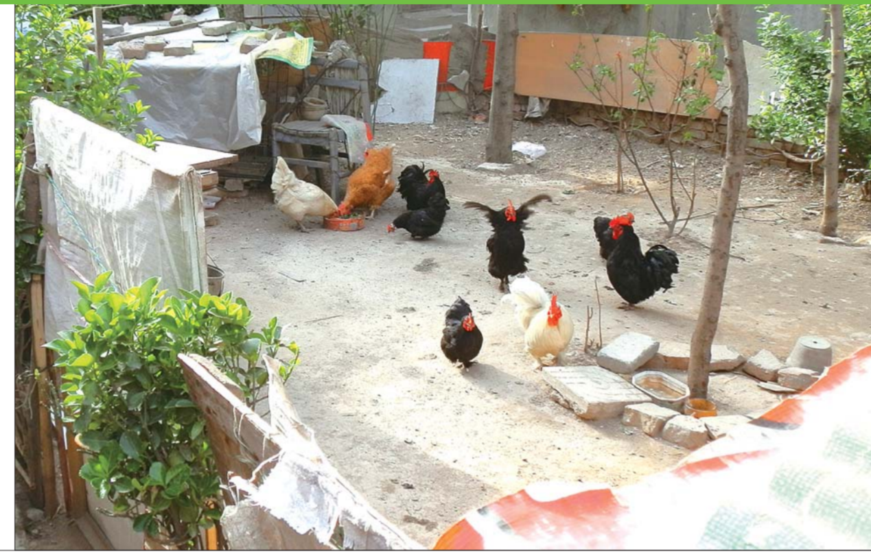
▶花园小区内,有不少人圈地养鸡。

8日下午3时许,记者又来到历城区花园小区中区,发现三区4号楼南侧的空地被改成了鸡圈,里面养着十几只鸡。5号楼南侧有一个笼子,里面锁着一些鸽子。6号楼北侧有几个鸡笼,但鸡都在笼子外面。