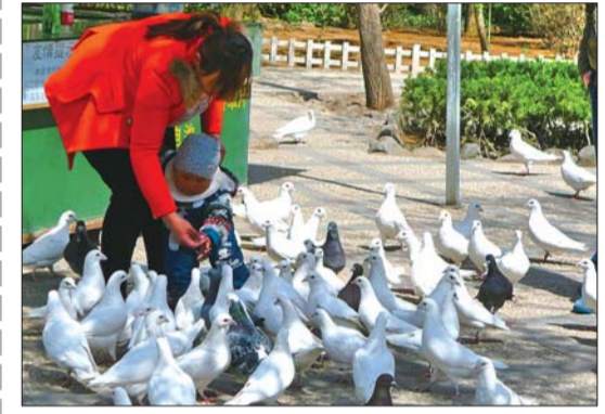
9日,在泉城公园,游客带着孩子与鸽子近距离接触。

据介绍,为确保安全,泉城广场的鸽子每年至少注射6次疫苗,工作人员每天对鸽舍和喂食场地进行冲刷消毒,对鸽子留下的粪便和污渍及时处理,并对饲料消毒。 饲养员说,除了给鸽子注射疫苗,每日三次消毒外,他自己也是时刻注意个人卫生,必须保证勤洗手,进舍戴口罩,不吃生食。