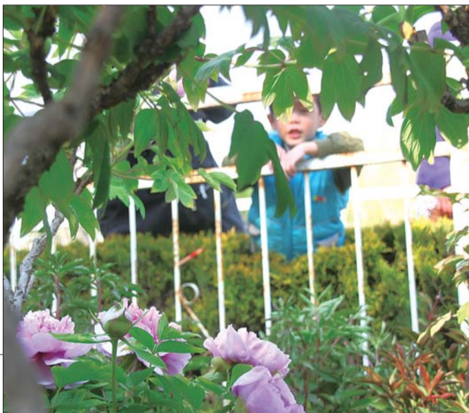
▶一位小朋友在家长的带领下观赏天香公园的牡丹。

小型牡丹园北侧的太极广场上,绕园小路上、东南角游乐设施里,随处可见游园的人们,赏花福利为天香公园带来了越来越旺的人气。