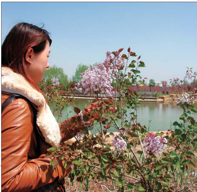
▶曹州牡丹园的红梅开了,此外已经开花的还有绿梅、榆叶梅等。

据曹州牡丹园技术部经理黄纯强介绍,目前园区内有20余种植物开花,有紫荆花、红梅、绿梅、樱花、梨花海棠、西府海棠、二月兰等,郁金香也将于近日开花。