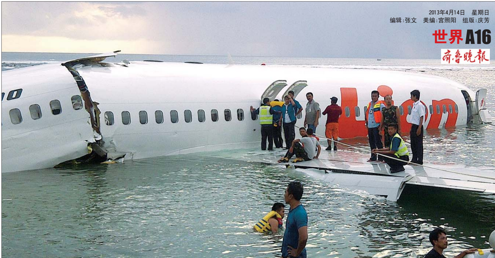
客机坠海后的救援现场。