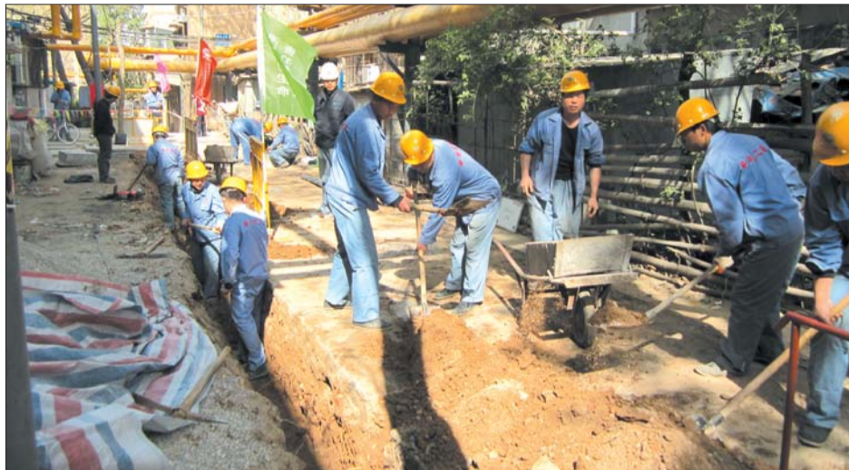
舜玉小区,工人们正在抓紧施工。

施工,科学调度,及时发放施工通知书,设置公示牌和施工围挡,为工地周边群众搭设便桥。施工改造工地将实行“当天干,当天恢复”的原则,严格控制开挖和安装进度,每天及时回填沟槽,挖出的渣土立即清运,并安排专人平整回填的石屑和洒水防尘,尽量做到不扰民。