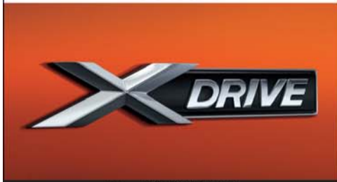
xDrive智能全轮驱动系统