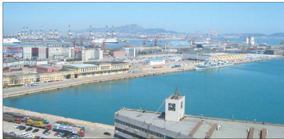
客滚船将从烟台驶往韩国平泽。