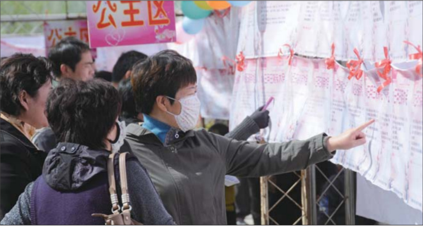
▲VIP现场,单身男女正在进行8分钟约会。 ▲不少家长前来替孩子相亲。 ▶相亲大会现场,人潮涌动,大家在认真寻觅。

申请现场报名,以及询问下一次相亲大会时间的问题。 除此之外,本报此次相亲大会增设了VIP互动专场、富豪专场,使得工作人员更加忙碌。“为此做了很多准备工作。”工作人员话音刚落,一位母亲带着自己的儿子来到了工作台,“能不能为我儿子报名,参加面对面相亲?” 工作人员告诉记者,参加VIP互动专场与富豪专场的相亲者,资料要经一一核实,并逐一电话通知核实,任一步骤都不能马虎。 “虽然今年更累,但是很多人借此现场牵手成功,我们觉得很值。”两天下来,工作人员已经筋疲力尽,但都觉得值得。