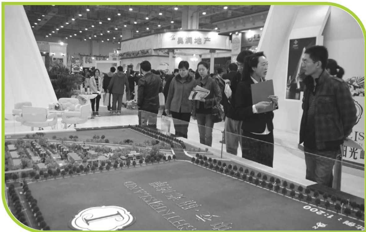
►2013青岛春季房地产展示交易会吸引了众多市民前来“淘”房。

12日至14日，“2013年青岛春季房地产展示交易会”在青岛市崂山区国际会展中心举行。除了吸引到房地产“大鳄”前来造势，海外房地产商也来抢夺青岛买方资源市场。业内人士建议，海外置业还需谨慎对待，市民不要盲目跟风。