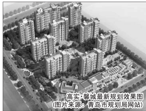
高实·馨城最新规划效果图

从地图上看，高实·馨城位于高新区核心地段，交通便利，河东路以北为正阳路。正阳路是城阳区的核心干道，跨越城阳区最繁华区域，项目南侧是青兰高速，可直达胶州及城阳流亭空港。高实·馨城周边有不少新建小区，周围房价最高房价在8000元/平方米左右，最低房价在5000元/平方米左右，居住生活氛围浓厚。